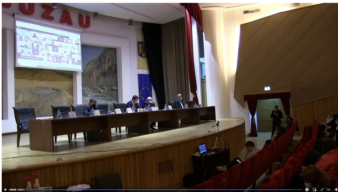
Biroul de presă al Inspectoratului Școlar Județean Buzău